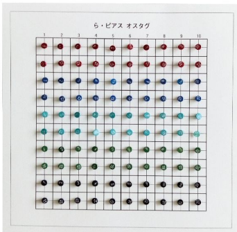
La Pierce tag

Boucles d'oreille numérotées et colorées pour une identification visuelle simple, adaptées à une utilisation sur de petits animaux de laboratoire.